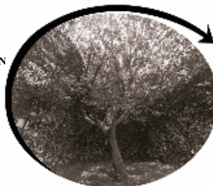
CENTRO DE INTERPRETACIÓN ÁRBOL GAROÉ (San Andrés) Todos los días de 10:00 a 19:00 h.