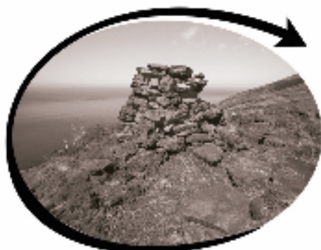
PARQUE CULTURAL DE EL JULAN (Carretera de El Julan) Rutas guiadas información y reserva: 922 55 84 23 de martes a domingo email: eljulan@gmail.com)

A partir del 1 de julio hasta el 30 de septiembre de 2019