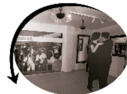
CENTRO DE INTERPRETACIÓN LA RESERVA DE LA BIOSFERA (Isora) Martes a domingo de 10:00 a 18:00 h.

Otros lugares de interés: ERMITA DE LOS REYES (La Dehesa) Abierto de martes a domingo de 10:00 a 17:30h de julio a septiembre de 10:00 a 18:00 h. Eucaristía 1er domingo de cada mes. Cerrado 25 de diciembre y 1 de enero