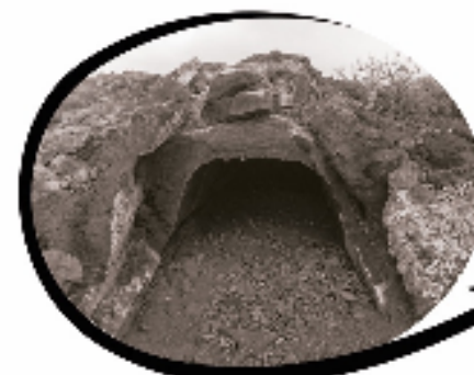
CENTRO DE INTERPRETACIÓN DEL GEOPARQUE (Carretera La Restinga) Martes a domingo de 10:00 a 18:00h.