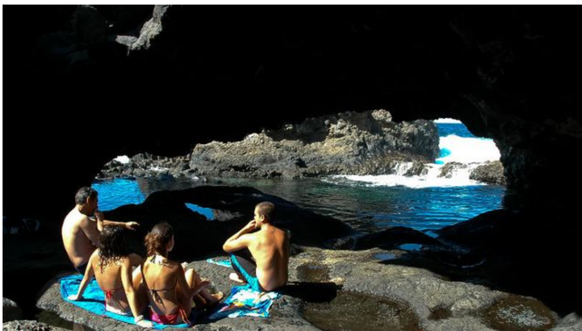
El Charco Azul, uno de los lugares insólitos y mágicos de la costa de El Hierro.

Pese a su carácter eminentemente rural, la isla más pequeña del Archipiélago canario también cuenta con un buen puñado de playas ideales para pasar un día de sol y mar. El estado prácticamente virgen de la costa herreña es un aliciente más para acercarse a esta isla singular que, por suerte, se ha cuidado de los excesos del turismo de masas.